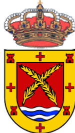
LOS SANTOS DE LA HUMOSA