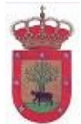
FRESNO DE TOROTE