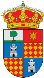
CAMARMA DE ESTERUELAS