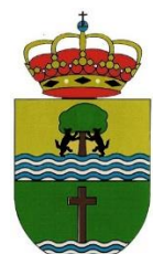
VALDETORRES DE JARAMA