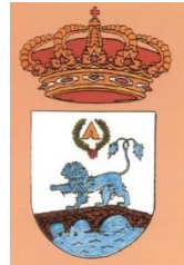
TALAMANCA DE JARAMA